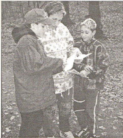
Herbst-OL: Die Blättlers vor dem Start