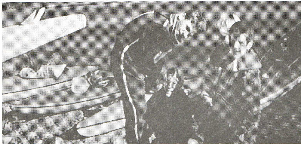
Das Wasser ist schon kalt und man weiss ja nie! Besser man stürzt sich -- unter Kommentar der Kameraden -- in den Taucheranzug.