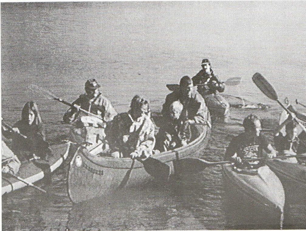
Sind alle bereit? Also kann es losgehen. 25 Kilometer Herbstwasser liegen vor dem Bug der Kajaks und Kanus.